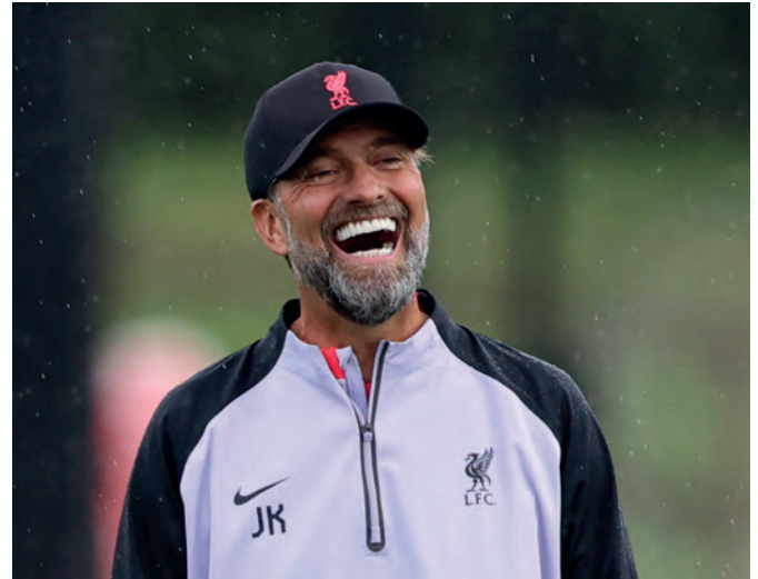
Bei der Produktion einer neuen Werbekampagne hat Jürgen Klopp gut gelacht: Dank KI wurde Klopps Stimme synthetisiert und sein Gesicht digitalisiert.