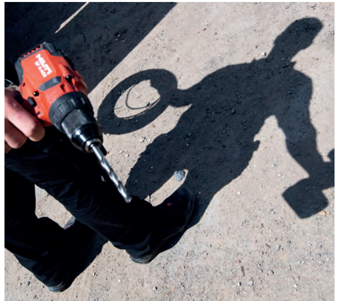
Demografie beschleunigt Fachkräftemangel in Deutschland: Bis 2060 könnte die Zahl der Menschen im erwerbstätigen Alter auf 34 Millionen sinken.