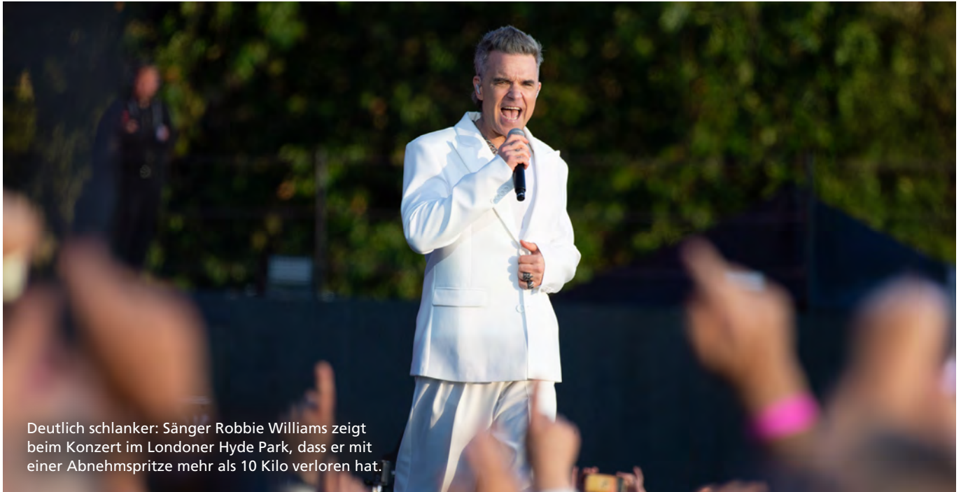
Deutlich schlanker: Sänger Robbie Williams zeigt beim Konzert im Londoner Hyde Park, dass er mit einer Abnehmspritze mehr als 10 Kilo verloren hat.